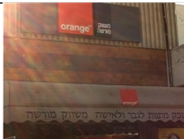
BOUTIQUE PARTNER ORANGE DANS LA COLONIE D'ARIEL

Collectif National pour une Paix Juste et Durable entre Palestiniens et Israéliens