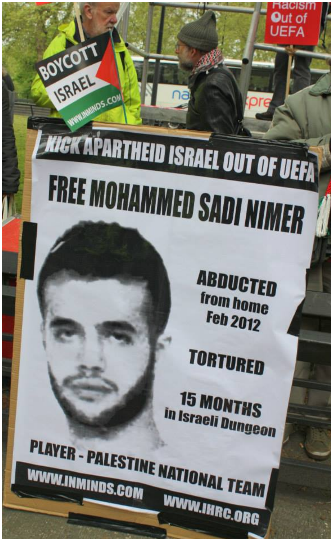
Footballeurs Palestiniens emprisonnés par l'Etat colonial d'apartheid israélien