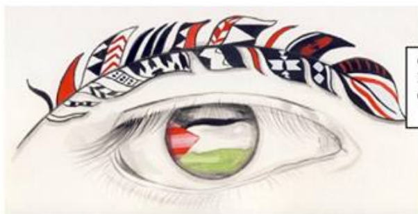
Couverture : Je vois la Palestine dans tes yeux Illustration de Céline Farine, inspirée du poème éponyme de Ziad Medoukh

A partir de deux exemplaires les frais de port sont gratuits, soit 10€ l'unité x nombre d'exemplaires.